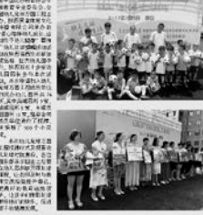
西安幼儿足球推广活动现场，孩子们和老师们一起合影。