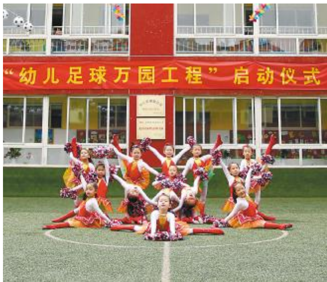
快乐幼儿足球啦啦操

本报讯 4月16日,全国幼儿足球大型公益活动“幼儿足球万园工程”启动仪式,在全国首家幼儿足球示范园——北京博凯智能全纳幼儿园隆重举行。