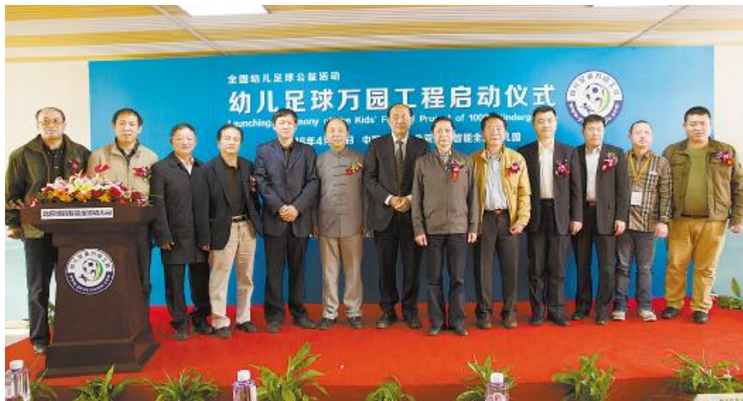
幼儿足球万园工程正式启动